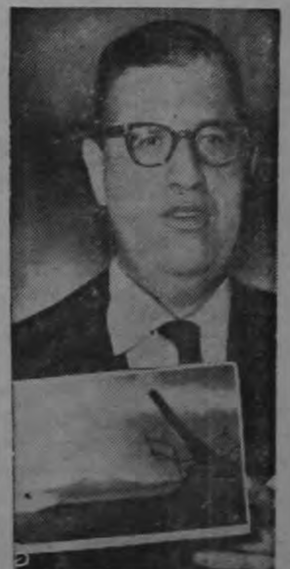
Abba Eban embajador israelí en las Naciones Unidas muestra una foto en donde aparece un emplazamiento de artillería egipcio en el golfo de Aqaba, después de conferenciar en Washington con el Secretario de Estado norteamericano Dulles.