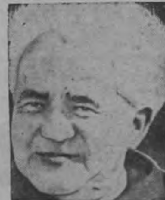
Premier BEN GURION

Constituyeron la Junta de Turismo Centroamericano con miras a trabajar en forma colectiva para promover el turismo hacia los países del Istmo. — (PAGINA 23)